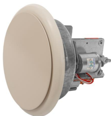
Elektrisch aangestuurd ventiel