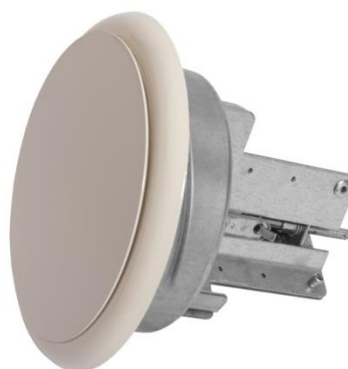
smeltlood 72 graden Celsius

Voor bestellingen: Sales@hpsmail.nl - 0593-33 17 76